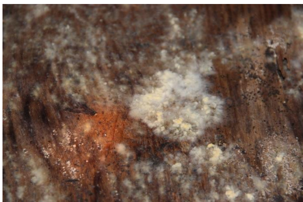
Attēlos –sēnes uz pagraba durvīm.