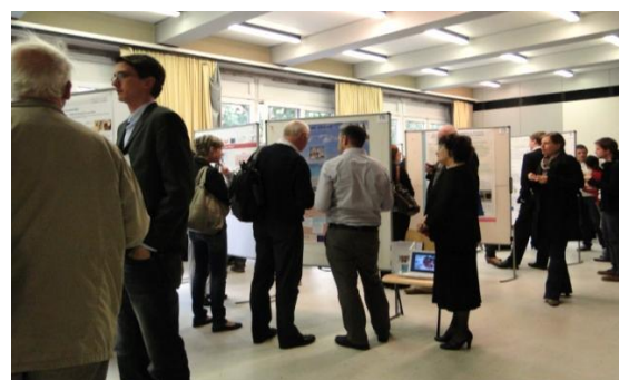
Interaktīvā plakātu sesija

Visi raksti, prezentācijas, lekcijas, plakāti un darbnīcu materiāli ir publicēti konferences rakstu izdevumā. Tas pieejams: http://ius.uni-klu.ac.at/misc/profiles/articles/view/29