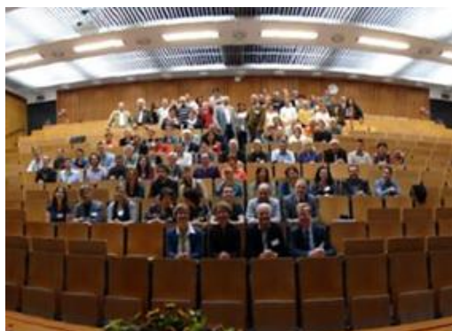
Konferences dalībnieki